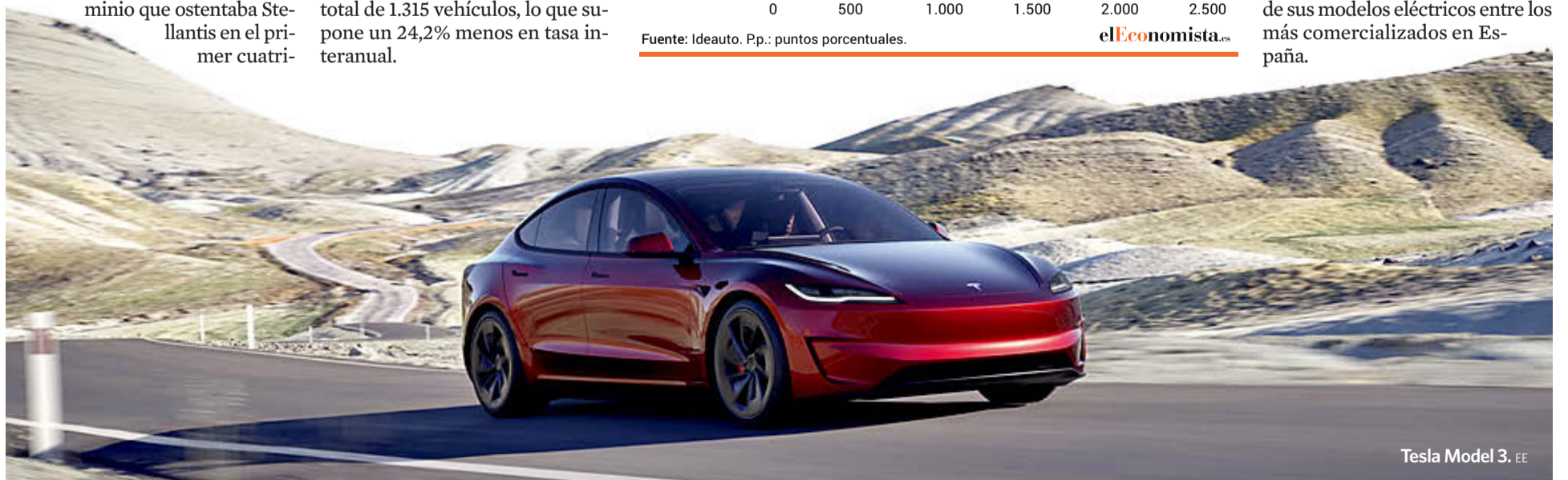
Tesla Model 3. EE

Este panorama ha cambiado desde 2020, dado que en los últimos cuatro años ningún grupo automovilístico ha logrado posicionarse a dos de sus modelos eléctricos entre los más comercializados en España.